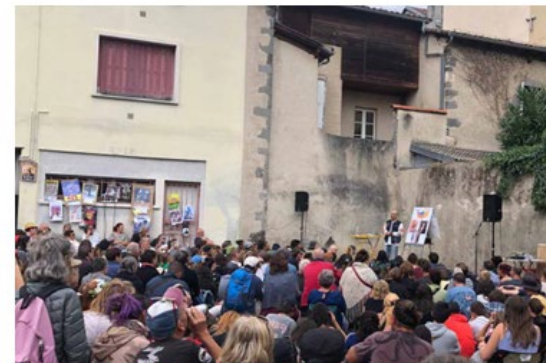
Sorties de résidences de GOLDI à Aix-en-Provence (Festival Zik-Zac) et au Touvet (Festival Place Libre) ; premières à Label Rue et à Aurillac.