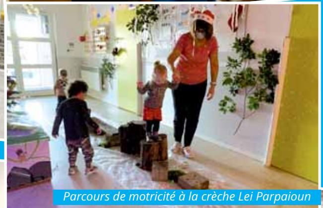
Parcours de motricité à la crèche Lei Parpaïoun