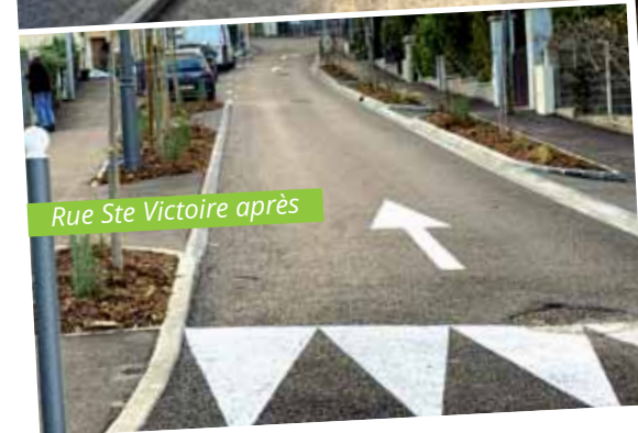
Rue Ste Victoire après