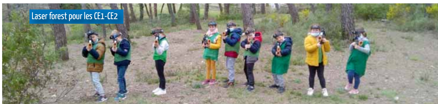
Laser forest pour les CE1-CE2

Au total, 223 enfants différents ont pu fréquenter l'accueil de loisirs des vacances de février où différentes activités leur ont été proposées (sportives, manuelles, culinaires, randonnée avec les ânes de la Sainte-Baume, Laser Forest aux Planes, cuisine moléculaire, chimie, spectacle pour enfants avec une compagnie de théâtre).