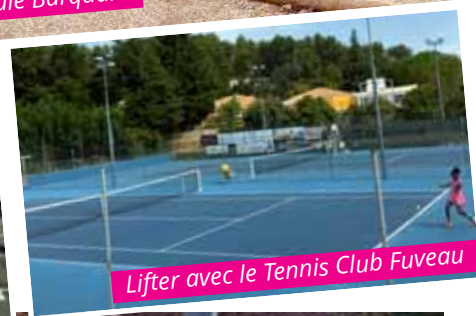
Lifter avec le Tennis Club Fuveau