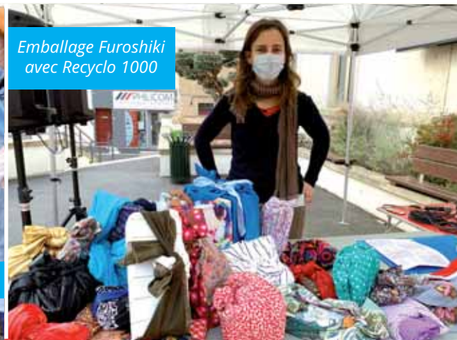
Emballage Furoshiki avec Recyclo 1000