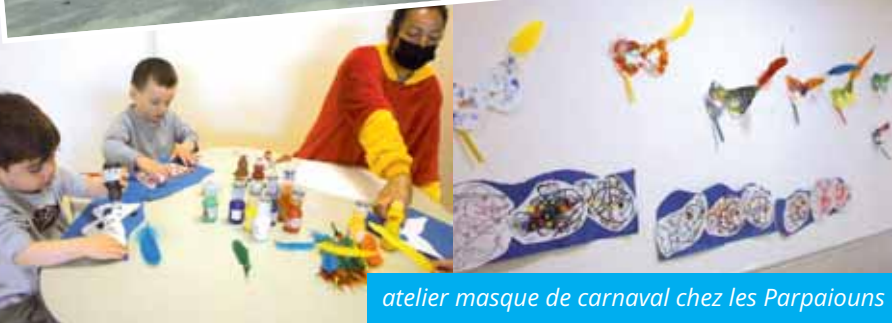
atelier masque de carnaval chez les Parpaioucs