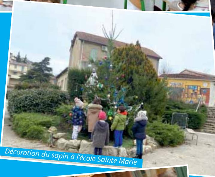
Décoration du sapin à l'école Sainte Marie