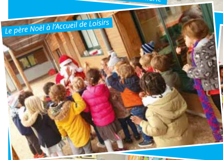
Le père Noël à l'Accueil de Loisirs