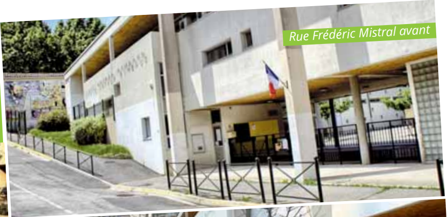
Rue Frédéric Mistral avant