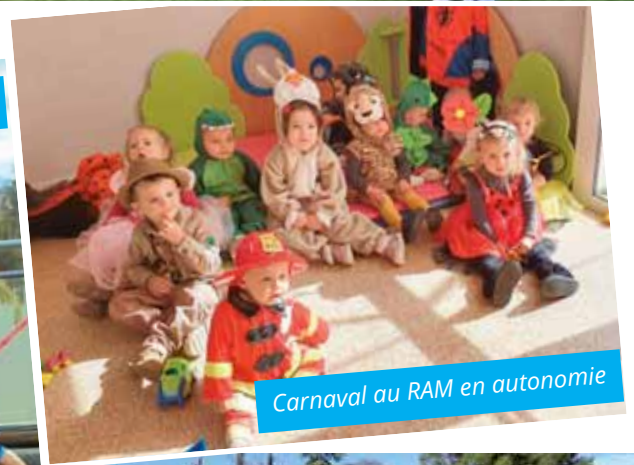
Carnaval au RAM en autonomie