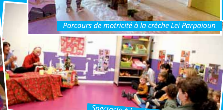
Spectacle à la crèche Les Moussaillons