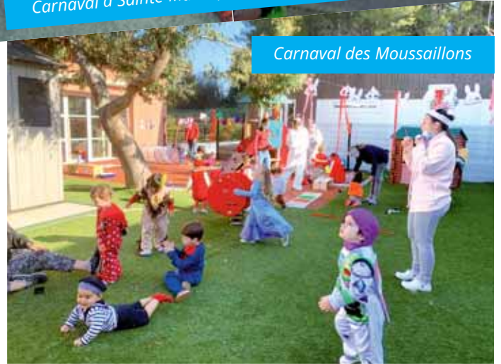
Carnaval des Moussaillons