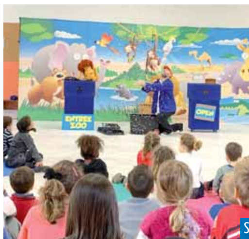
Spectacle "Le zoo des tout-petits" pour les maternelles

Au total, 223 enfants différents ont pu fréquenter l'accueil de loisirs des vacances de février où différentes activités leur ont été proposées (sportives, manuelles, culinaires, randonnée avec les ânes de la Sainte-Baume, Laser Forest aux Planes, cuisine moléculaire, chimie, spectacle pour enfants avec une compagnie de théâtre).