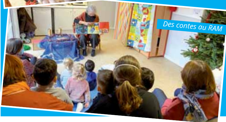
Des contes au RAM