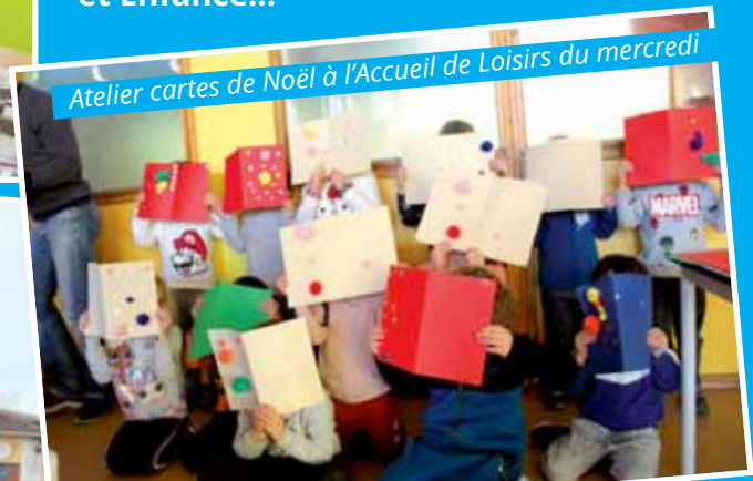
Atelier cartes de Noël à l'Accueil de Loisirs du mercredi