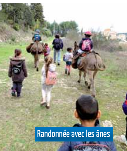
Randonnée avec les ânes