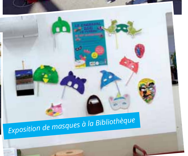
Exposition de masques à la Bibliothèque