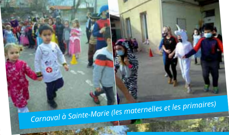
Carnaval à Sainte-Marie (les maternelles et les primaires)