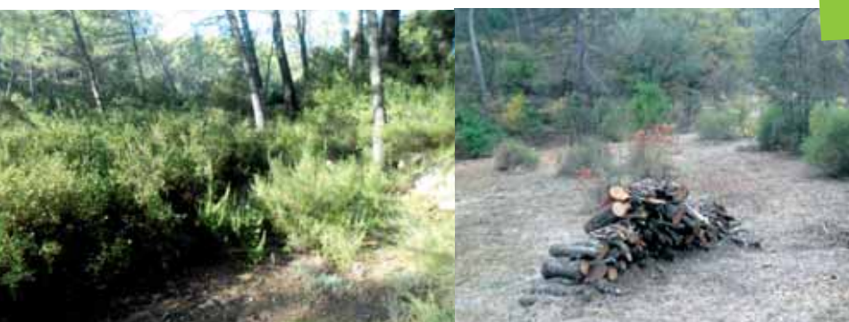
Les déchets végétaux peuvent être compostés ou déposés en déchetterie. L'usage du feu est réglementé par arrêté préfectoral n°2013354-004 du 20 décembre 2013

Les services techniques continuent de débroussailler les parcelles communales. En effet, sur 97% du territoire de la Commune, le débroussaillage est obligatoire pour réduire les risques d'incendie. Attention cependant, tous les mois ne sont pas propices à cette activité !