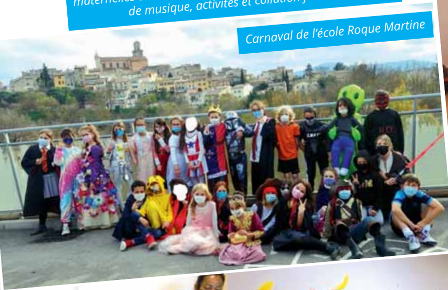
Carnaval de l'école Roque Martine