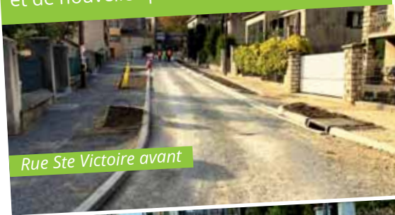
Rue Ste Victoire avant

Les travaux des rues Ste Victoire et Frédéric Mistral se sont terminés en décembre. Ces rues possèdent à présent un cheminement piéton sécurisé, un parvis spacieux devant l'école, des éclairages basse consommation et de nouvelles plantations.