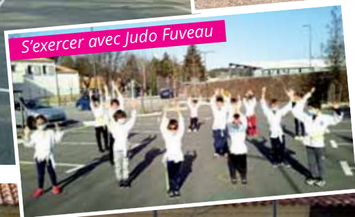
S'exercer avec Judo Fuveau