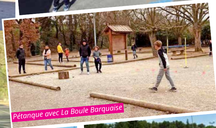
Pétanque avec La Boule Barquaise