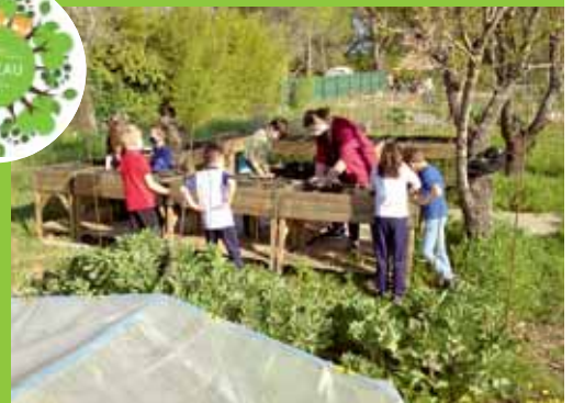
Un exemple de projet de développement durable : les enfants de CM1 de l'école Rimbaud plantent salades et fraises aux jardins partagés dans les bacs du CCAS