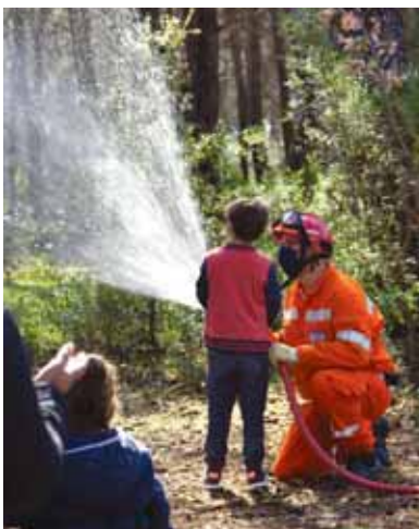
Démonstration de la lance à eau

Le 21 mars, Fuveau a participé à la journée internationale des forêts : une occasion de célébrer la forêt, l'arbre et le bois et de sensibiliser à sa préservation. L'arbre, la forêt et le bois ont d'importantes fonctions écologiques, économiques et sociales. Grâce à des animations, des ateliers, des expos ou des démonstrations, cette manifestation a permis de faire découvrir aux Fuvélains notre patrimoine forestier considérable et son importance en matière de développement durable.