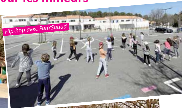
Hip-hop avec Fam'Squad