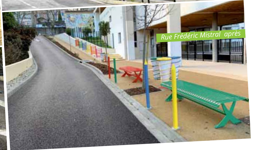
Rue Frédéric Mistral après