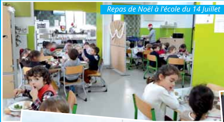
Repas de Noël à l'école du 14 Juillet