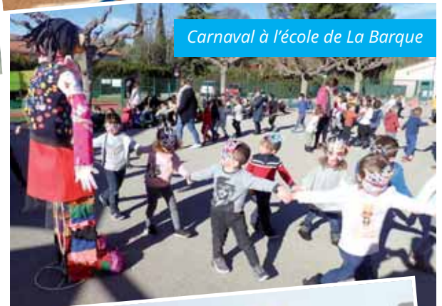
Carnaval à l'école de La Barque