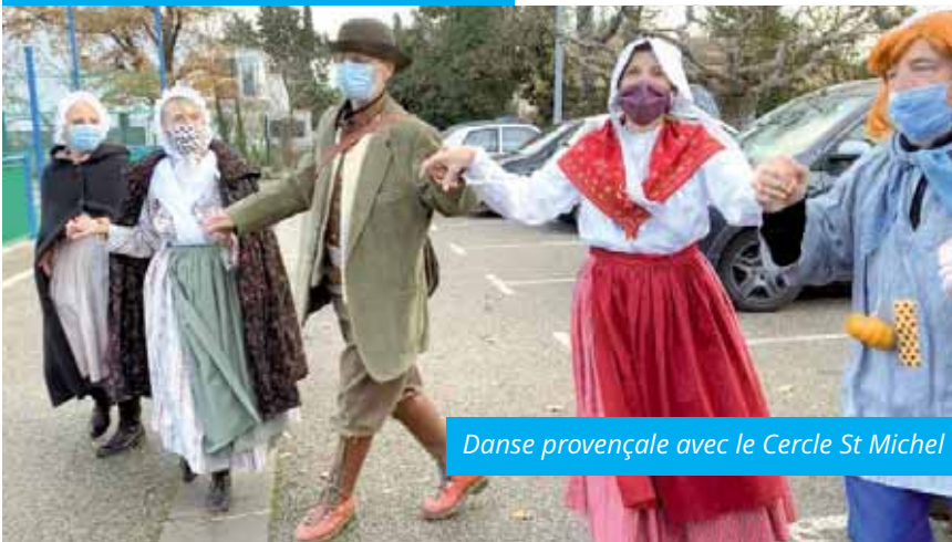
Danse provençale avec le Cercle St Michel