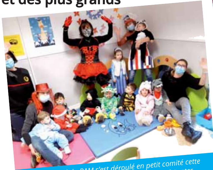
Le carnaval du RAM s'est déroulé en petit comité cette année. 12 enfants accompagnés de 5 assistantes maternelles de Fuveau ont pu partager un moment convivial de musique, activités et collation festive.