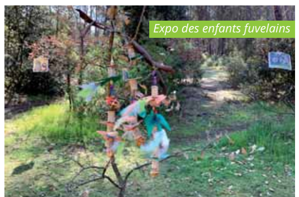
Expo des enfants fuvélains