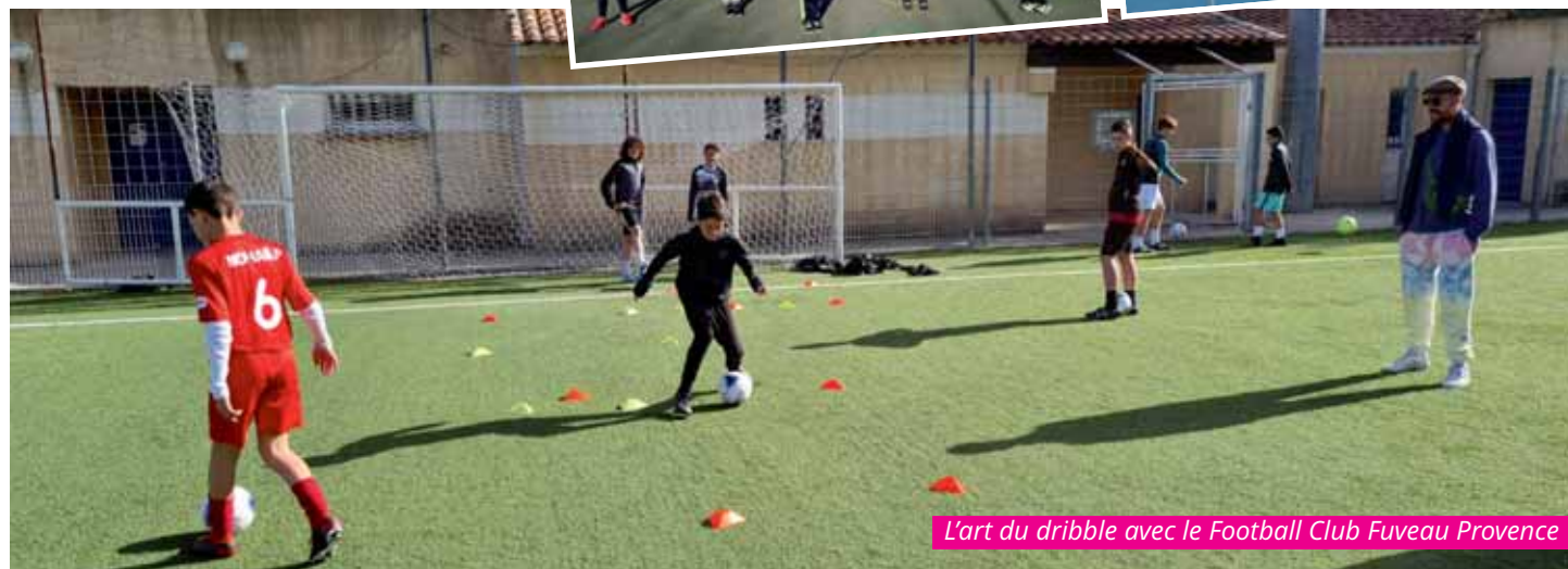
L'art du dribble avec le Football Club Fuveau Provence