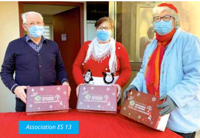
Association ES 13