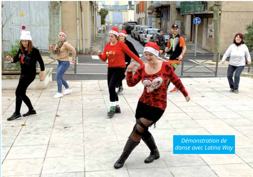
Démonstration de danse avec Latina Way