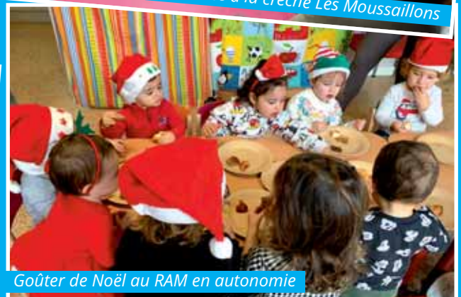
Goûter de Noël au RAM en autonomie