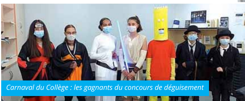
Carnaval du Collège : les gagnants du concours de déguisement