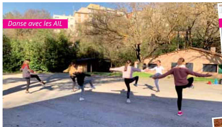
Danse avec les AIL