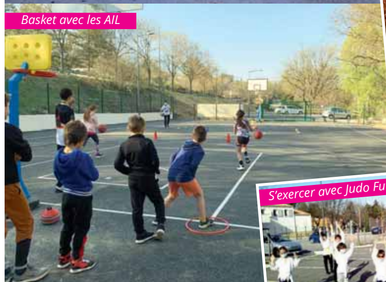
Basket avec les AIL